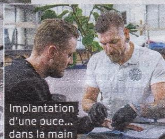
Implantation d'une puce... dans la main

V ous pensiez que seuls votre chien ou votre chat en avaient une ? Aujourd'hui, les puces électroniques sont partout ! Caché derrière une technologie résumée en quatre initiales, RFID (pour « Radio Frequency Identification »), ce petit carré, qui contient une multitude d'informations, est en passe de reléguer aux oubliettes le scan du code-barres lors du passage en caisses. Ainsi, chez Decathlon, Etam ou Nespresso, il suffit de déposer vos articles dans un récipient pour voir, sur un écran, le nombre de produits et le montant total. Un gain de temps côté clients... et côté enseignes : elles s'en servent pour stocker des données (le nombre de fois où tel article a été essayé sans être acheté, par exemple) et élaborer leur stratégie commerciale.